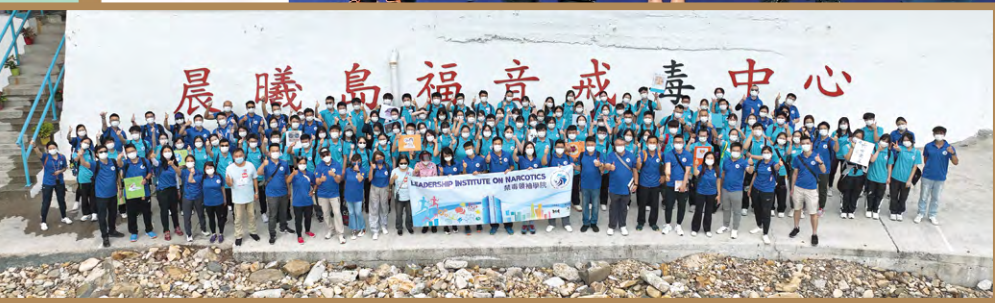
▼禁毒領袖學院安排百名學員參觀晨曦島的戒毒中心，了解吸毒者生活，加深學員對毒品禍害的了解。