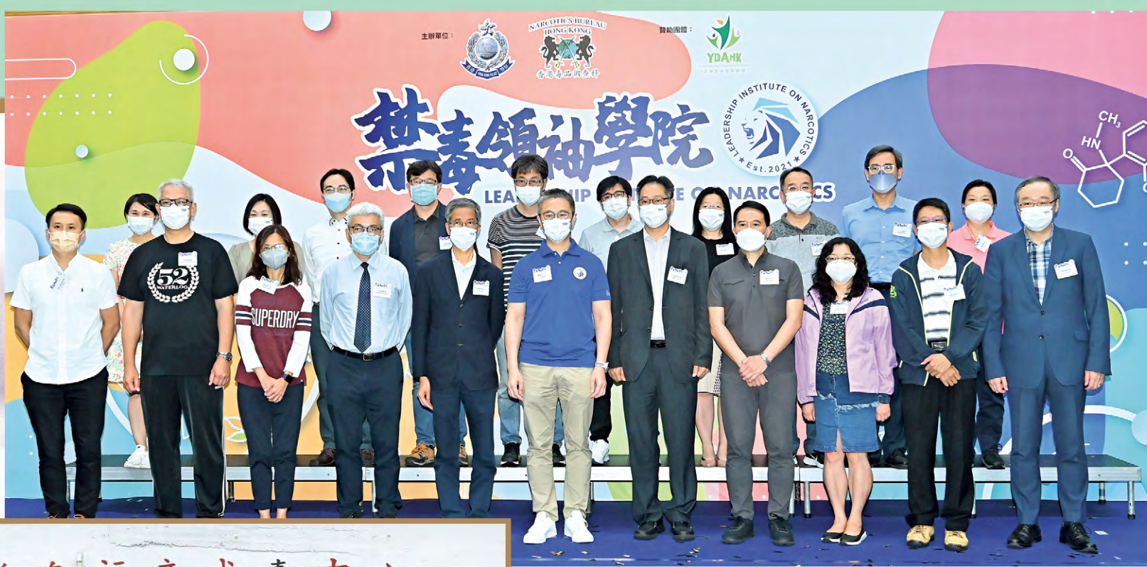
▲早前舉行啟動禮的禁毒領袖學院，是警務處首個以抗毒為主題的大型青少年教育及宣傳活動。