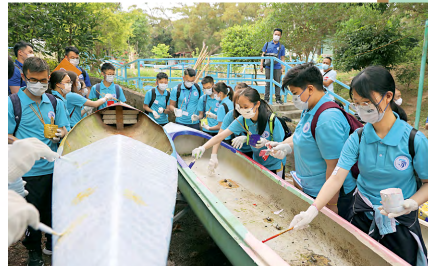
▲參加抗毒計劃的學員，合力翻新破舊獨木舟，發揮團隊精神。

位 於西貢外島伙頭洲的晨曦島，距離西貢碼頭約一小時船程，島上設有「晨曦島福音戒毒中心」，專為男性吸毒者提供脫癮治療，平日絕少人出入。今年五月七日星期六早上，島上出現逾一百名參觀者，他們正是「禁毒領袖學院」的執行委員會成員、顧問、導師及學生。