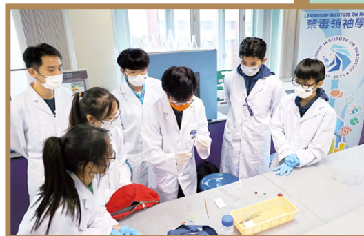
▼學員早前獲安排到香港浸會大學實驗室，接受化學系教授教導毒品化學成分，學習鑑定毒品及體驗仿製毒品氣味。