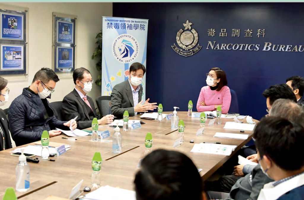
▲禁毒領袖學院設有一個執行委員會，監察整個計劃的活動安排及資金運作。