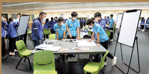
▲參與抗毒計劃的一百名學生，分成二十組接受訓練，每組包括四名中學生及一名大學生。

專業顧問團則邀請十名醫生、大學教授、律師、社工、金融保險總監、科技及培訓專家，設計及策劃課程，提升學員才幹及力能。導師團二十名專業人士帶領學員執行抗毒計劃。