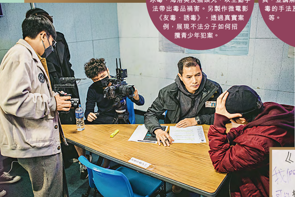
▲毒品調查科製作微電影《友毒·誘毒》，展現不法分子如何招攬青少年犯案。